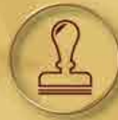
周年續牌 Annual Renewal