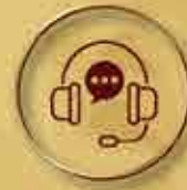
商務秘書 Commercial Secretary