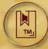
商標註冊 Trademark Registration