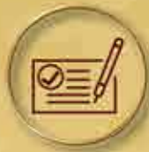
文件認證 Document Authentication