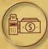
稅務會計 Tax and Accounting