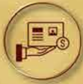
銀行開戶 Bank Account Opening