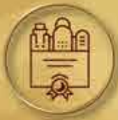
公司註冊 Company Formation