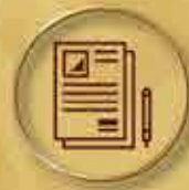
簽證申請 Visa Application